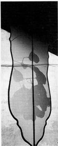
gabriele fettolini pintura