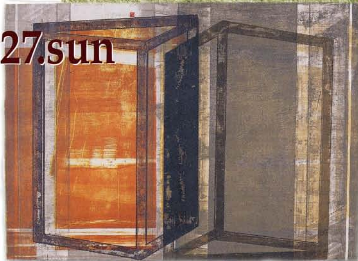
《優秀賞》 作家=ガブリエル・フェットリーニ 出身国=スイス 作品名=無題 技法=リトグラフ 和紙制作者=塩 彰一 和紙名=雁皮紙