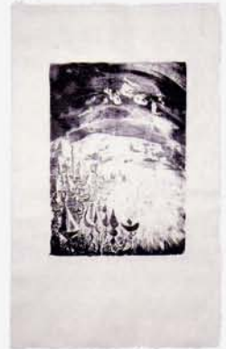
6 パウ スビオラ 光子による焙炎 リヨッチャ美術学校 63×38 リトグラフ(石版) 2007 西村 信吾 三極紙

Pepa Busqué Civil Lights Escola Llotja's profesora 62.5×41.5 Impressió Digital 2007 Shingo Nishimura mitsumata papel