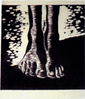
1 イサベル フェレル 無題 リヨッチャ美術学校 40×39 木版 2007 西村 信吾 三極紙

Isabel Ferrer S.T Escola Llotja 40×39 Xilografia 2007 Shingo Nishimura mitsumata papel