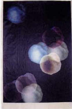
5 ペパ ブスケ 都市の灯光 リヨッチャ美術学校(銅版画科教授) 62.5×41.5 デジタルプリント 2007 西村 信吾 三極紙

Hose Vanegas S.T Escola Llotja 45×45.5 Litografia 2007 Toshiro Taniguchi kozo papel