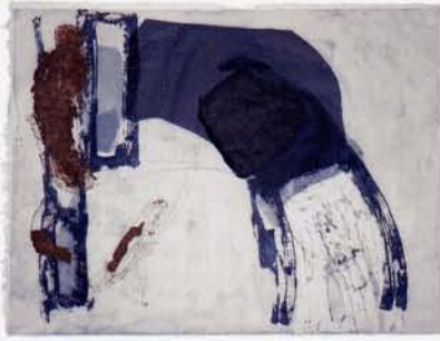
2 エヴァ エスクェール 無題 リヨッチャ美術学校 49×64.5 アクアチント, エッチング・ポリエステル 2007 長谷川 憲人 雁皮紙 半白

Isabel Ferrer S.T Escola Llotja 40×39 Xilografia 2007 Shingo Nishimura mitsumata papel