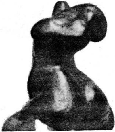
"Pesadilla No. 2" hecha en cemento por el escultor colombiano José Alfredo Vanegas.

En la sede Secab se exponen actualmente las esculturas de José Alfredo Vanegas y de Alberto Orlando Díaz, ambos escultores especializados en la Universidad Nacional de Colombia.