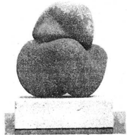
"Venus de dos piezas", escultura en granito de Alfredo Vanegas para la exposición en el Convenio "Andrés Bello".